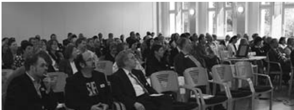
Erster Kongress der Pflegewissenschaft in Vallendar im Juni 2009 war gut besucht.

Unter der Schirmherrschaft der rheinland-pfälzischen Sozialministerin Malu Dreyer fand am 4. und 5. Juni 2009 der erste Vallendarer Kongress der Pflegewissenschaft unter dem Motto „Gerechtigkeit und Solidarität im Gesundheitswesen“ statt. Mit rund 150 Teilnehmern aus Leitung, Praxis und Wissenschaft im Sozial- und Gesundheitswesen sowie aus Politik, Kirche und Gesellschaft war der Kongress gut besucht. Es wurde interdisziplinär über die verschiedenen Facetten der Gerechtigkeit und Solidarität diskutiert. Renommiertere Experten aus Pflegewissenschaft, Medizinethik, Sozialökonomie, Politikwissenschaft und Theologie aus dem In- und Ausland hielten Vorträge und boten zahlreiche Workshops an. So wurden Ansätze einer neuen Care-Ethik diskutiert auch um der schleichenden Rationierung von Gesundheitsleistungen entgegenzuwirken. Der Kongress fand in der Philosophisch-Theologischen Hochschule Vallendar (PTHV) bei Koblenz statt. Mit diesem Kongress hat die Pflegewissenschaft einen wichtigen Beitrag zum interdisziplinären Austausch um eines der bedeutenden Zukunftsthemen geleistet.