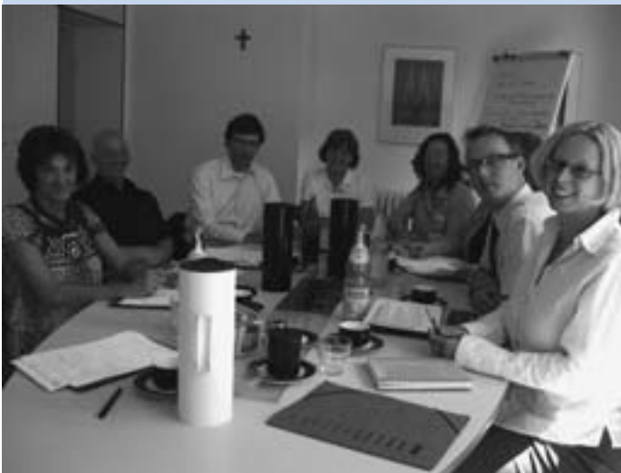
Teilnehmer/-innen des Auftaktworkshops in Köln.

und der Arbeits- und Kommunikationsbeziehung zu den Bewohner/-innen und Angehörigen ableitet, wird ebenso die Beziehung der Pflegekräfte untereinander und zu ihren Vorgesetzten betrachtet. Im Rahmen des Projektes sollen Tools entwickelt und umgesetzt werden, die den Mitarbeitern eine größere Identifikation mit ihrer Arbeit und den Ergebnissen ihrer Arbeit ermöglichen. Das Projekt beginnt mit einer umfassenden Analyse zur Ist-Situation in den Einrichtungen im Herbst dieses Jahres. Es läuft über einen Zeitraum von insgesamt 30 Monaten und wird gefördert vom Bundesministerium für Bildung und Forschung aus dem Europäischen Sozialfonds der Europäischen Union.