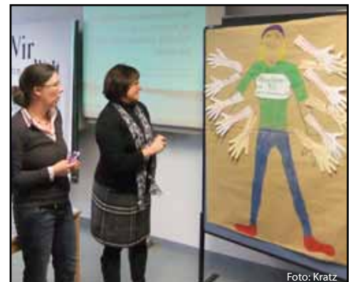
Studienreferendarinnen im Studienseminar für das Lehramt an berufsbildenden Schulen in Neuwied

eine einschlägige Berufsausbildung sowie mindestens zwei Jahre Berufserfahrung verfügen. Für das Studium werden keine Studiengebühren erhoben. Grundlage für den Studiengang ist die in der Abstimmung befindliche entsprechende Landesverordnung für die Ausbildung von Lehrerinnen und Lehrern für das Fach Pflege.